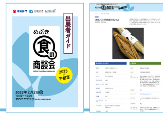
出展者ガイドとWEBページ(2022年)のイメージ

2023年2月2日(木) 10:00~16:00 (オープニングセレモニー 9:40) 宇都宮市 マロニエプラザ