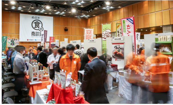
写真：展示商談会の様子（「めぶき食の商談会 2018 in つくば」から）