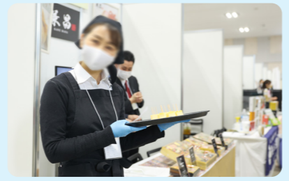
展示商談会の様子（「めぶき 食の商談会 2023 in 宇都宮」から）

「めぶき 食の商談会」は、地域の食関連業界のみなさまを幅広くお迎えし、たくさんの出会いの場を提供させていただきます。みなさまのご参加を心よりお待ちしております。