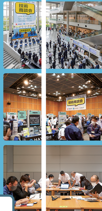
* 2022年開催の様子です。

2023年8月30日(水) 10:00～17:00 (オープニングセレモニー 9:45) つくば国際会議場